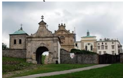
ŚWIĘTY KRZYŻ 28.09.2024